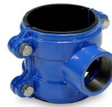
1 CONEXIÓN PE