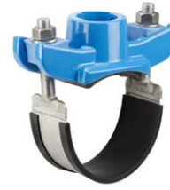
1 CONEXIÓN FD